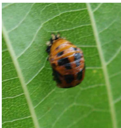
Coccinelle stade nymphe

Le seuil de tolérance est dépassé. Mais les coccinelles ne sont pas très loin