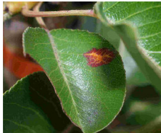
Rouille grillagée du poirier

Si la septoriose est sans conséquences réelles sur le développement des cornus, il faut impérativement éviter le développement de la rouille grillagée des Poiriers.