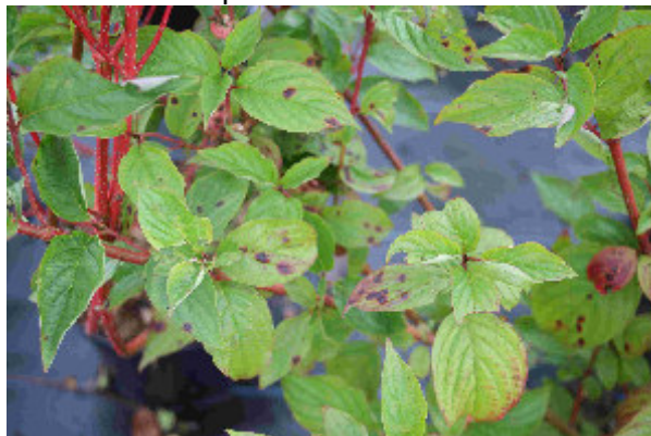
Septoriose sur feuille de cornouiller