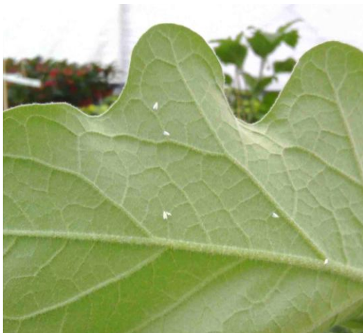
aleurodes sur feuille d'aubergine placée dans une culture de poinsettia

(mise en évidence de la toile qui entoure la fleur par pulvérisation d'eau).