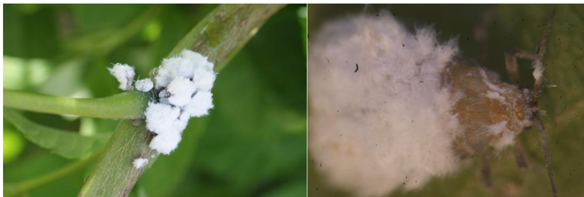
Figure 2: Colonie et individu isolé (sous loupe binoculaire) de puceron laineux (AREXHOR GE)

Des pucerons lanigères (laineux) ont été observés en pépinières sur frênes. Bien plus grands que les cochenilles farineuses, ils se déplacent aussi plus vite. Lors de l'observation de ces foyers, la présence de coccinelle prédatrice a aussi été notée, traduisant une gestion naturelle du ravageur.