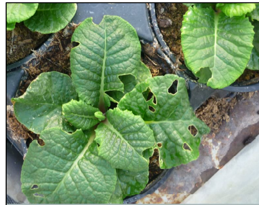
Dégâts de chenilles défoliatrices sur primevères.

Les chenilles sont encore bien présentes dans les exploitations et notamment sur primevères. Les températures douces des derniers jours leur sont favorables.